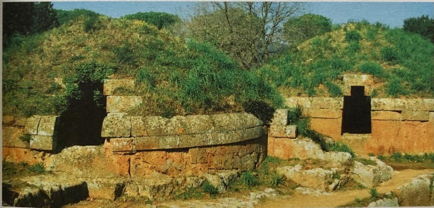
Obr. 2 – Nekropole v Cerveteri

Nekropole – doslova „ města mrtvých “ – byla stavěna v blízkosti skutečných měst. Etruské zvyklosti nedovolovaly, aby byli zemřelí pohřbíváni uvnitř městských hradeb. Nejrozměrnější z hrobek mají průměr až 48 metrů.