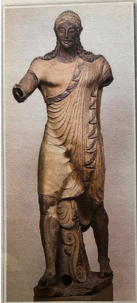
Obr. 5 – Socha Apollóna z Vejí Tato terakotová socha patří k tomu nejlepšímu z etruského sochařství. Socha pravděpodobně zdobila svatyni bohyně Menvy v etruském městě Veje .