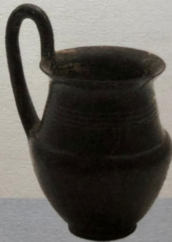
Obr. 6 – Etruská keramika Typická etruská keramika měla černou barvu, čehož se dosahovalo jednak výběrem vhodné hlíny a jednak technikou vypalování.