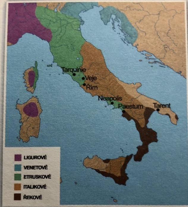
Obr. 1 – Osídlení Apeninského poloostrova v 6. století př. n. l.

Podle názvů jednotlivých kmenů se dodnes nazývají části Itálie – např. Liguria = Ligurie (Ligurové), Veneto = Benátsko (Venetové), Umbria = Umbrie (Umbrové)